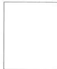
Huella digital (Índice derecho)

_____ Firma del postulante Apellidos y Nombres: DNI N°: