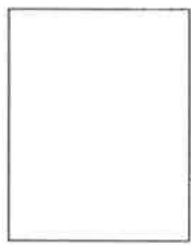
Huella digital (Índice derecho)

..... Firma del postulante Apellidos y Nombres: Número de DNI: